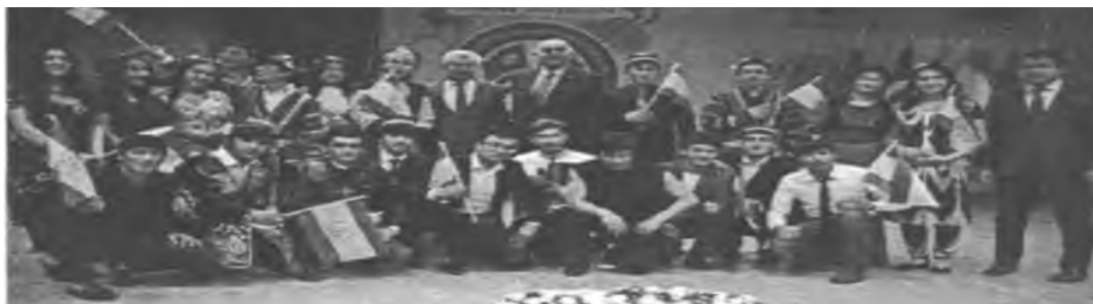
7. Kültürel faaliyet olarak Tacikistan gününe ilişkin fotoğraf