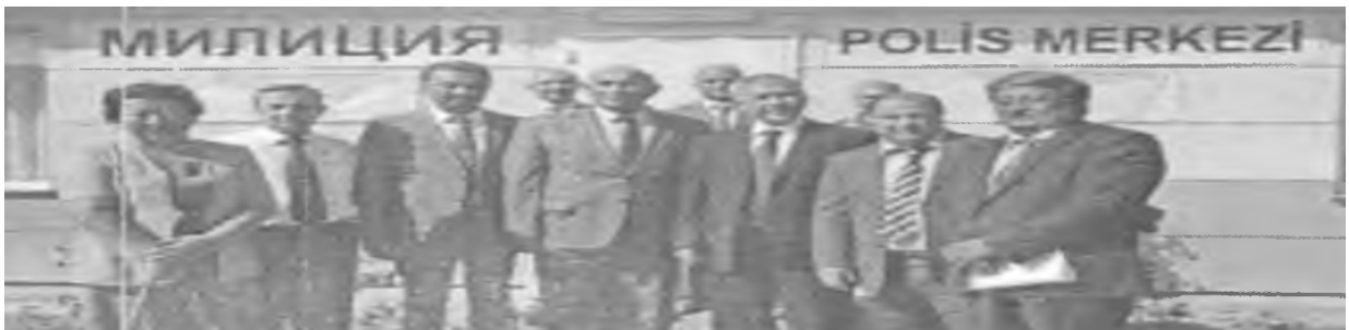
12. Üniversite kampüsünde polis merkezinin açılışına ilişkin fotoğraf