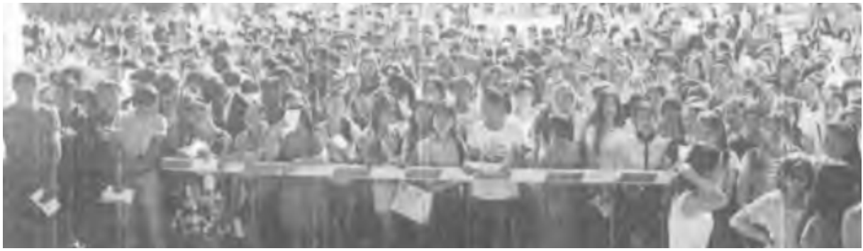
10. Üniversite giriş sınavına ilişkin fotoğraf