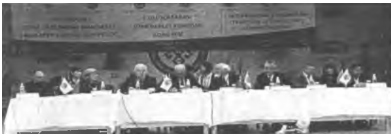
4. Üniversite'de yapılan bilimsel çalışmalara ilişkin bir haber fotoğrafı