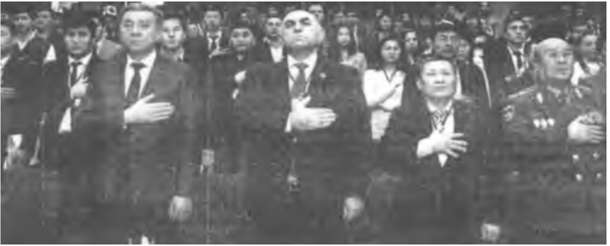
14. Üniversitede bir etkinlik açılışına ilişkin fotoğraf