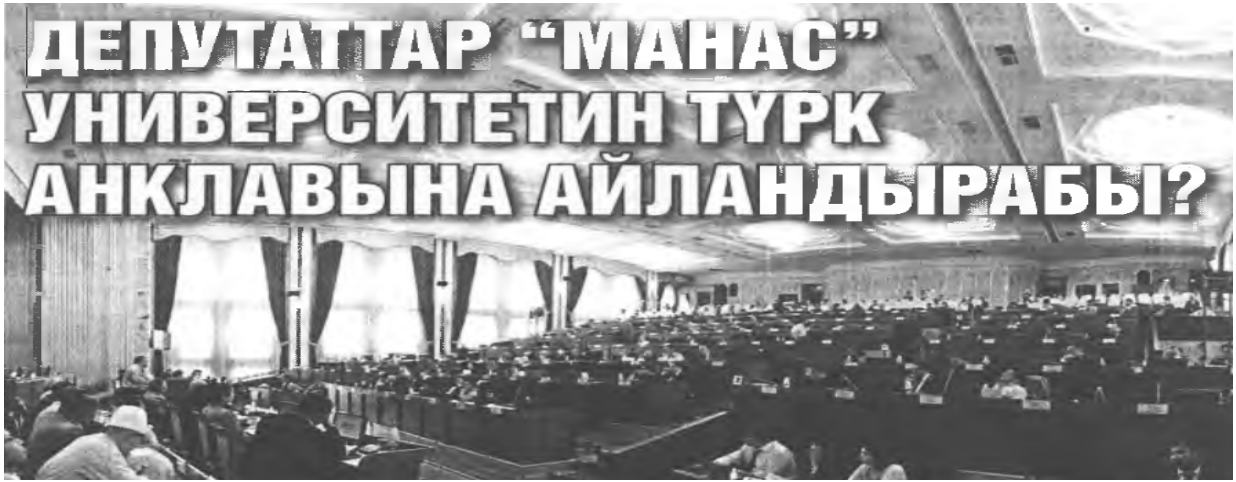
11. KC Parlamentosunda Üniversitenin tüzü