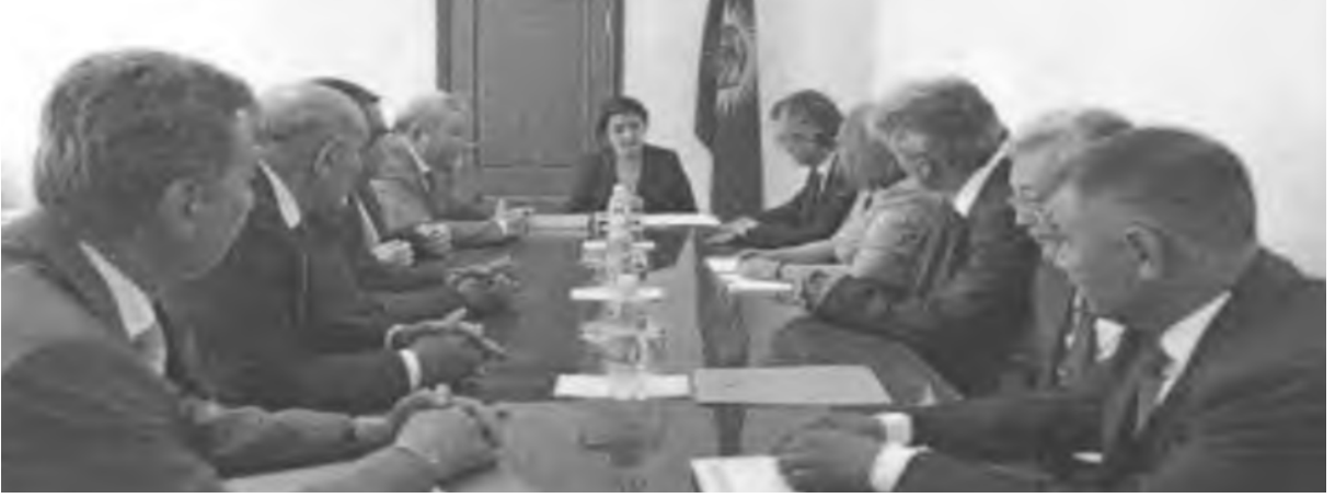
13. Mütevelli Hayatinin K.C Başbakanlığı ile görüşmesine ilişkin fotoğraf