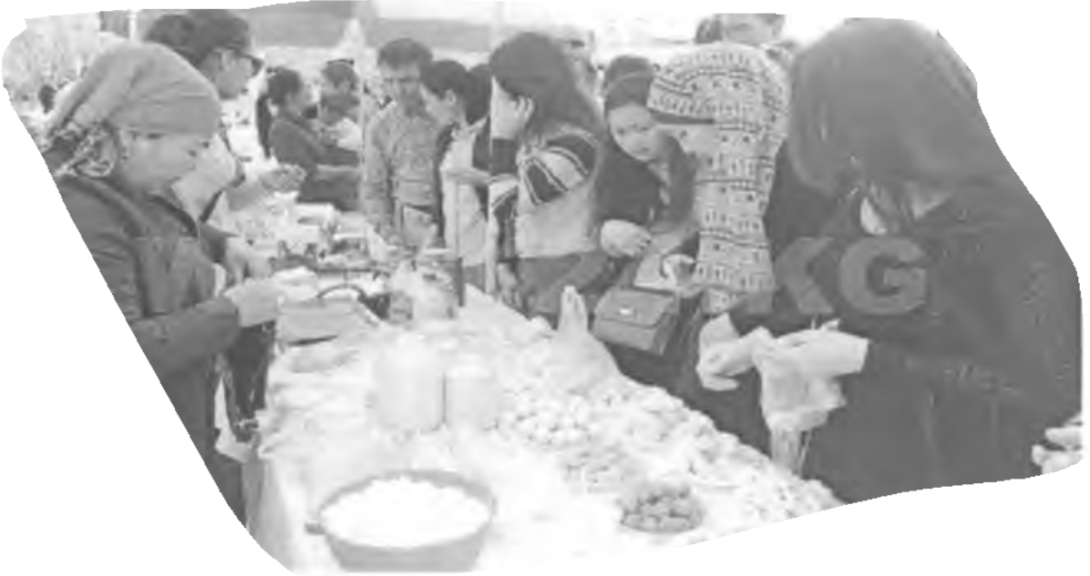
15. Kurut festivalinin açılışına ilişkin fotoğraf