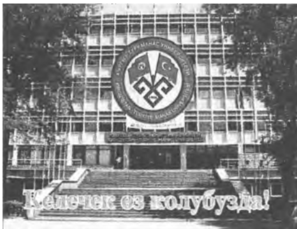
1. Üniversitenin tanıtımına ilişkin haber fotoğrafı