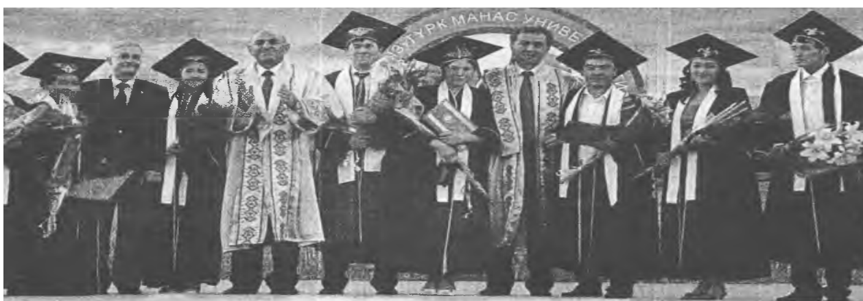
3. Mezuniyet törenine ilişkin fotoğraf