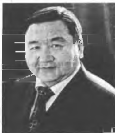
5. Üniversite öğretim elamanlarının yazmış olduğu makaleye ilişkin fotoğraf

ис» универ- іркүм про- ди эскерүү үнүн алка- аратын- дин мемо- у жайдын иденттик зы дарска- зана ушул а профес- тууралуу тебинин