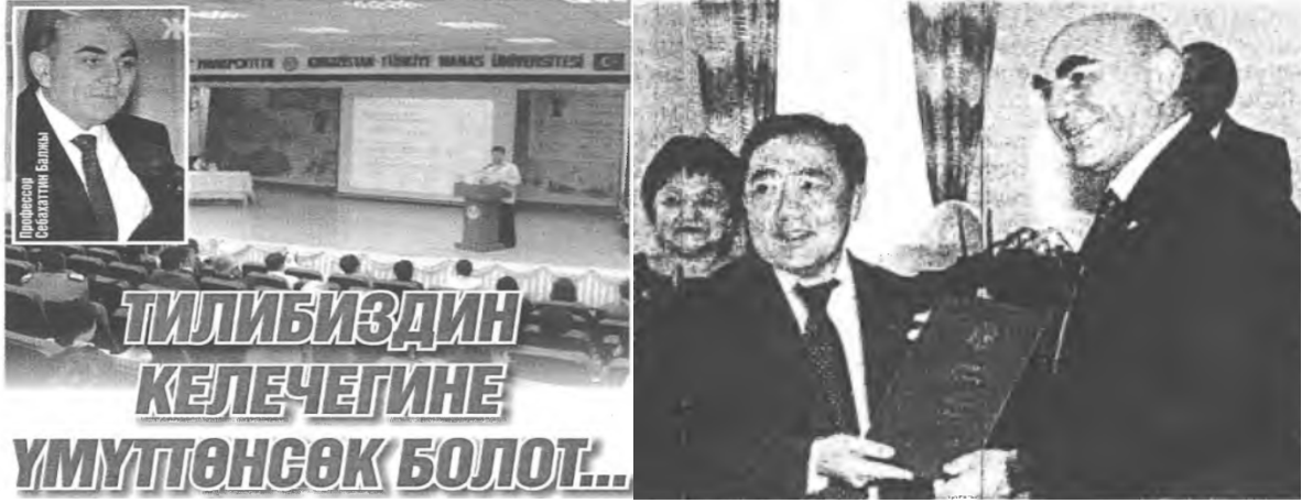
8. Kırgız dilinin gelişimine yönelik etkinlik fotoğrafı 9. Sosyal sorumluluk bağlamında fotoğraf